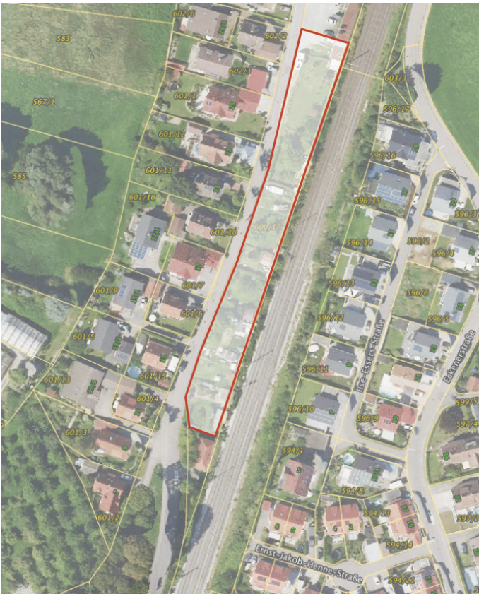
Abbildung 1: Lageplan Flst.Nr. 600/17

in zentraler Lage von Meckenbeuren – Flst. Nr. 600/17, Schillerstraße Meckenbeuren