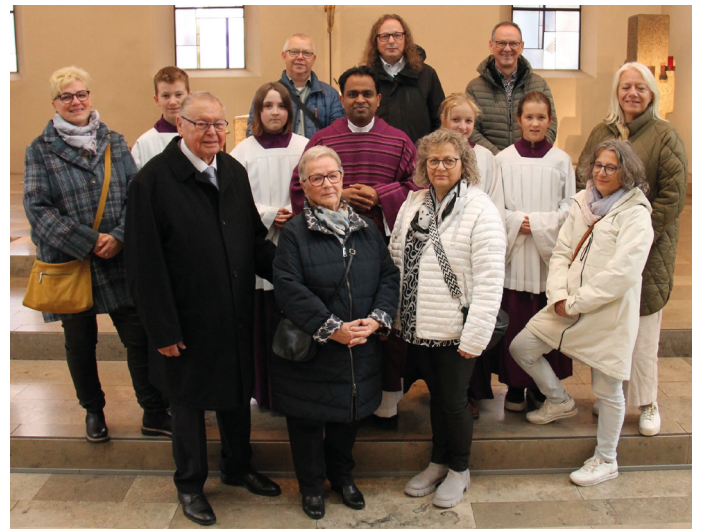
Text u. Foto: Wilhelm Amann

der Pfarrer ihm ein Präsent und wünschte ihm viel Gesundheit und Freude für sein weiteres Leben.