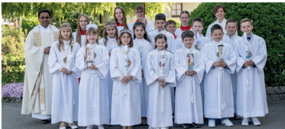
Unsere Erstkommunionkinder in St. Verena