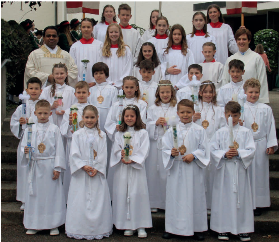
Unsere Erstkommunionkinder in St. Jakobus