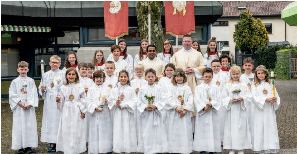
Unsere Erstkommunionkinder in St. Maria