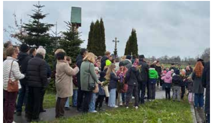
Foto: Kehlen Palmsonntag