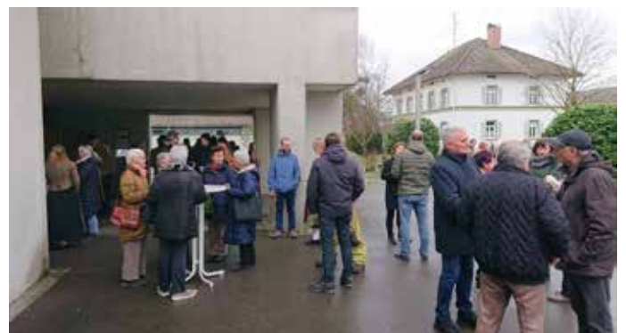
Foto: Kehlen Palmbrezeln