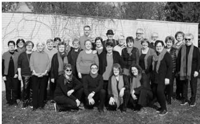
Chor "KLANGVOLL" der Chorgemeinschaft Liederkrantz Ailingen und die Band "Just Sax & Friends" von der Musikschule Meckenbeuren

Die Veranstalter freuen sich auf zahlreiche Besucher. Eintrittskarten sind zum Preis von 17 Euro bei den Chormitgliedern sowie an der Abendkasse erhältlich.