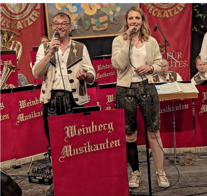
Am Sonntagnachmittag zu Gast: die Weinberg Musikanten.