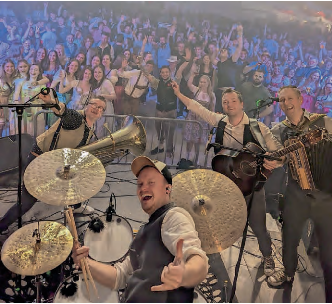
Am Schlossfest-Samstag ist bei BRASS meets BEATS volle Hütte vorprogrammiert!