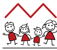
Eduard-Mörrike Grundschule Liebenau