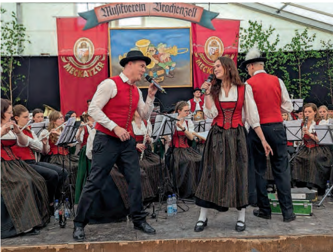
Wir freuen uns jetzt schon darauf, beim Frühschoppen am Sonntag das Zelt in Schwung zu bringen.