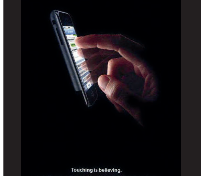
Gleiche Handhaltung: Gemälde „Der ungläubige Thomas“ von Caravaggio (1601) und erste iPhone-Werbung (2007)

Steve Jobs, der Gründer und Chef der amerikanischen Computerfirma Apple, war im Jahr 2007 überzeugt, etwas Großes erfunden zu haben – etwas, das die Welt verändern würde: Ein Mobiltelefon, das keine Tasten mehr hatte, sondern einen berührungsempfindlichen Bildschirm, und mit dem man nicht nur telefonieren und SMS-Nachrichten schreiben, sondern sich auch mit dem Internet verbinden konnte: Das erste iPhone!