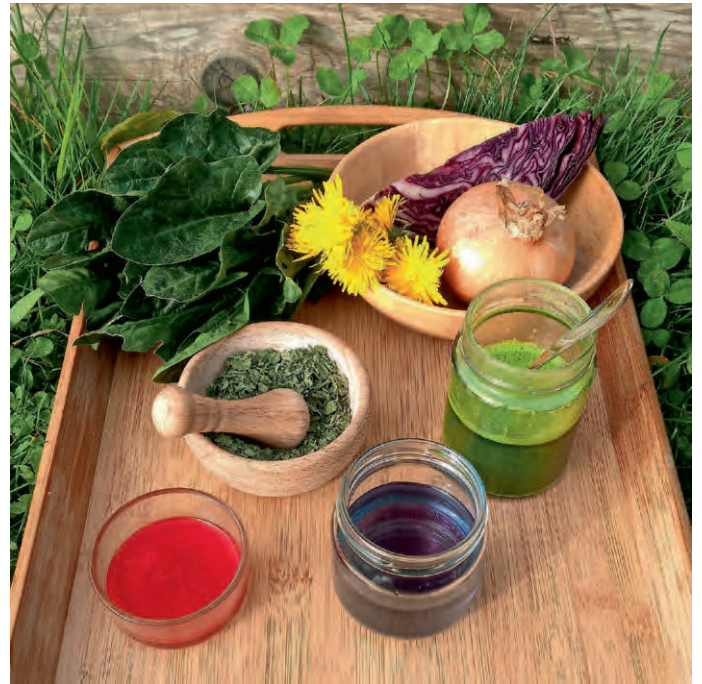
Farben aus Pflanzen

Die Aktion ist kostenfrei, eine kleine Spende ist willkommen. Die Teilnahme ist nur nach Anmeldung möglich. Die Veranstaltung findet nur bei trockener Witterung statt.