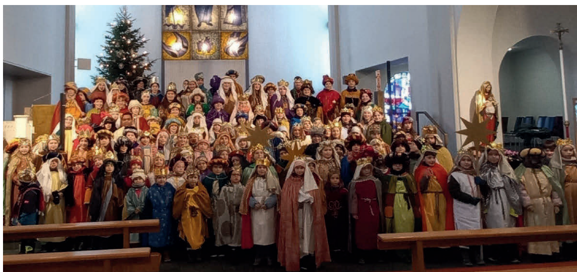
Lesen Sie unter den jeweiligen Rubriken der Kirchengemeinden, wie die Aktionen im Einzelnen verlaufen sind.

Die Organisationsteams von St. Maria Meckenbeuren St. Verena Kehlen St. Jakobus Brochenzell