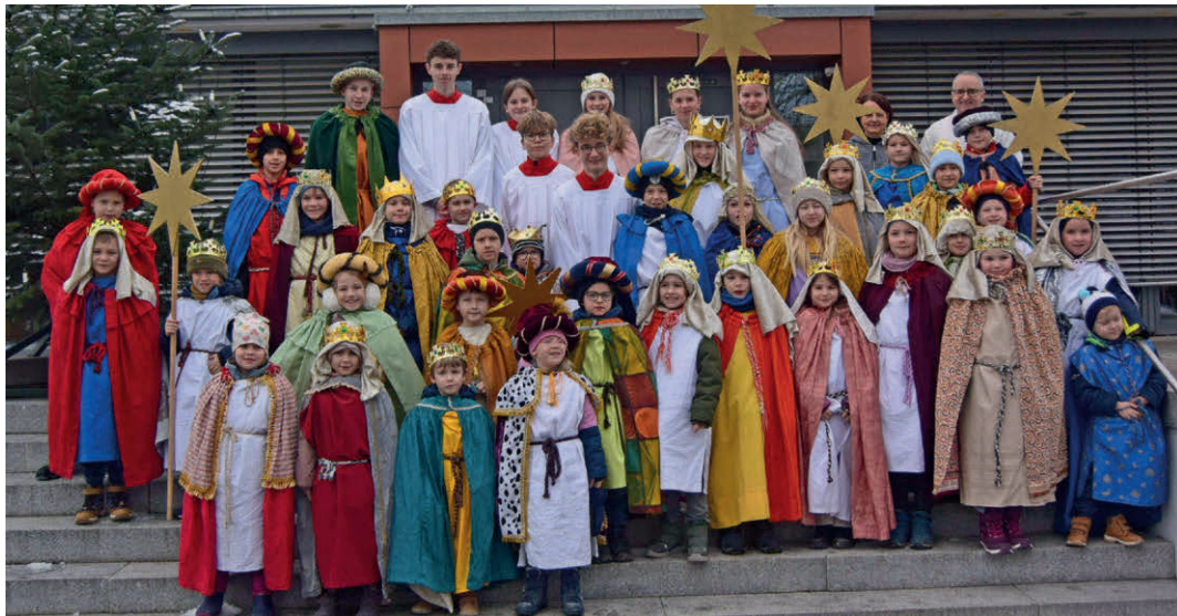
Gruppenfoto unserer engagierten Kehlener Sternsinger

Bei den Hausbesuchen am 3. und 4. Januar waren unterwegs: