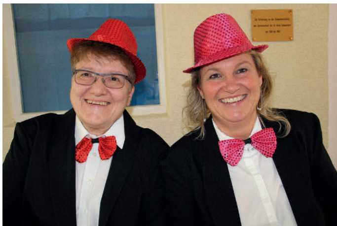
Hereinspaziert, es wird magisch. So lädt Kehlens Seniorenteam alle ein.