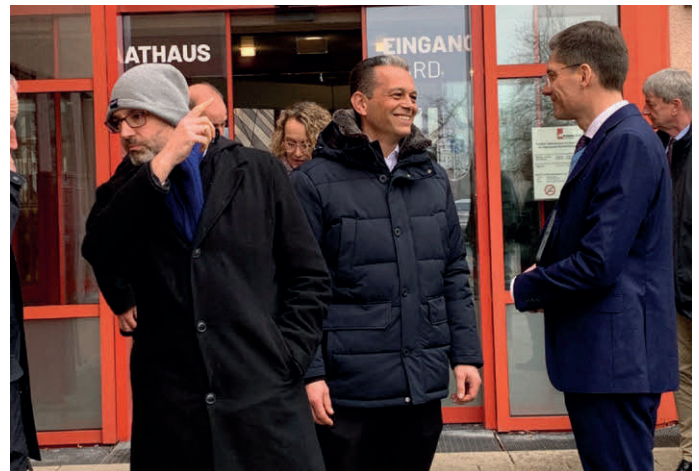
BU: Der Parlamentarische Staatssekretär Christian Hirte besucht Meckenbeuren – direkt vor Ort fanden Gespräche über den Planungsstand der B30-neu statt.

Die Planungen zur B30 betreffen im Bodenseekreis die Städte und Gemeinden Friedrichshafen, Meckenbeuren und Tettang. Ziel des Projekts ist es, die Ortsdurchfahrten zu entlasten, die Verkehrssicherheit zu erhöhen, Unfallrisiken und Umweltbelastungen zu verringern sowie bestehende Kapazitätsengpässe zu beseitigen. Für Meckenbeuren bedeutet dies insbesondere eine deutliche Verkehrsberuhigung der Ortsmitte und des Ortsteils Liebenau mit einem täglichen Verkehrsaufkommen von über 22.000 Fahrzeugen, darunter rund 850 Lkw.