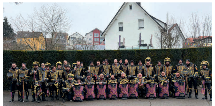
Gruppenbild nach dem Umzug vom VSAN – Ringtreffen in Stockach